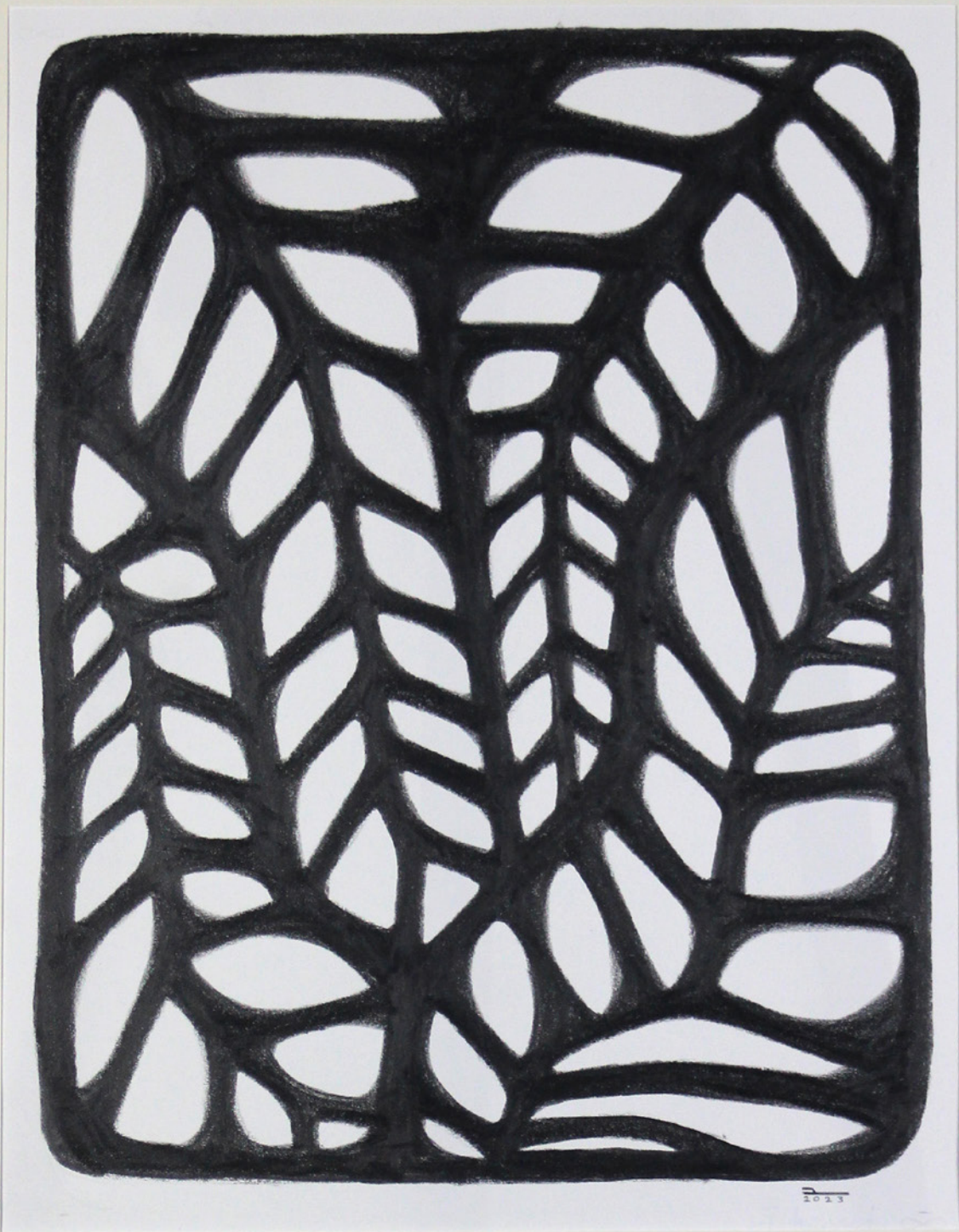
Demeter 120723 - 2023 Dessin à la craie graphite. Format 50 x 65 cm. Papier Johannot 130 g.