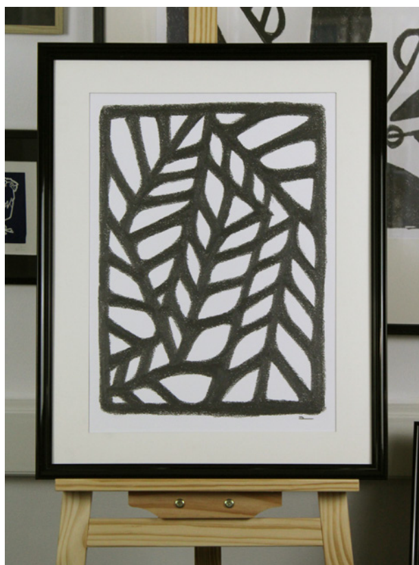
Demeter 140723 – 2023 Dessin à la craie graphite. Format 32,5 x 46 cm. Papier aquarelle 300 g.