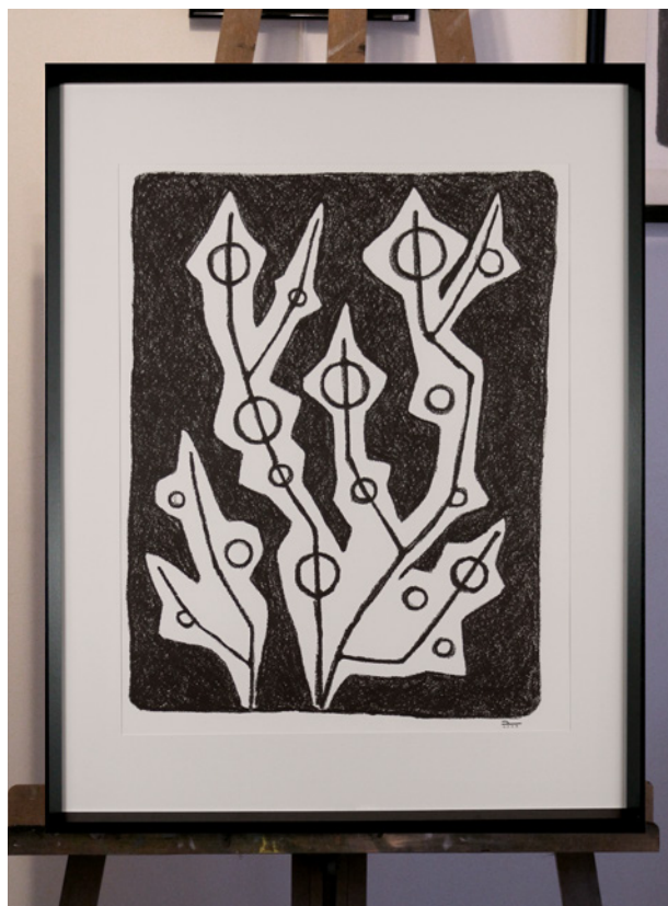
Algues 20523 – 2023 Dessin à la craie pastel. Format 50 x 65 cm. Papier aquarelle Montval 300 g.