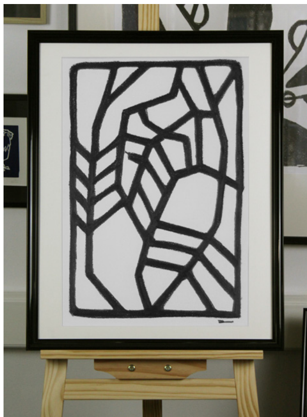
Demeter 10823 – 2023 Dessin à la craie graphite. Format 32,5 x 46 cm. Papier aquarelle 300 g.

On est ici aux limites de la figuration, cette série emprunte à Déméter sa couronne d'épis de blés. Les forces de la nature attribuées à la déesse antique et le blé nourricier illustrent le contraste du mouvement qui rythme les saisons.