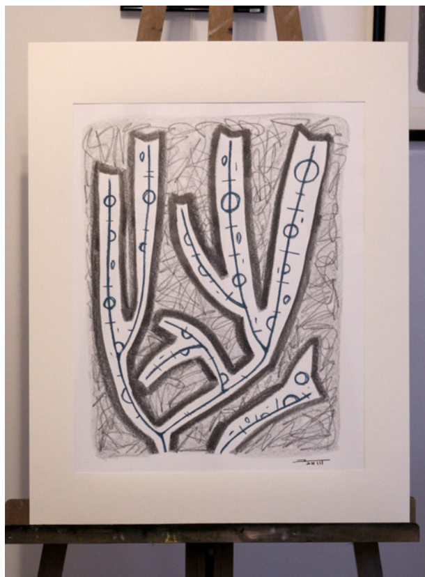
Algues 90523-3 – 2023 Dessin à la craie graphite et craie grasse. Format 50 x 65 cm. Papier Johannot 130 g.

Cette série débutée en 2023 entame une longue recherche sur la forme des algues dans différents supports et formats. Souples, légères, sombres ou inquiétantes, elles sont aussi différentes que semblables et nous invitent à la rencontre du profond océan.