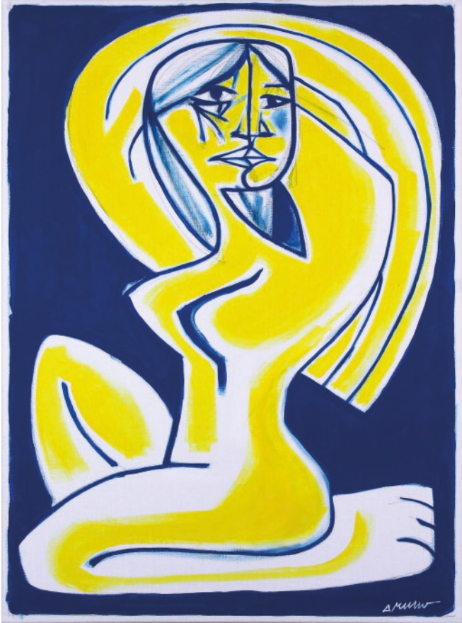
Bain de soleil jaune t bleu. Peinture sur toile format 73 x 54 cm.