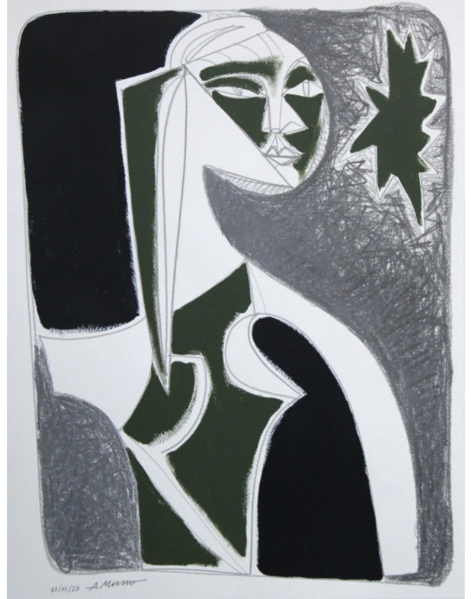
Femme dans un jardin. Technique mixte sur papier format 65 x 50 cm.