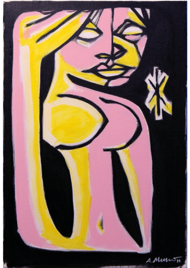
Femme avec la main dans les cheveux. Peinture sur toile format 55 x 38 cm.