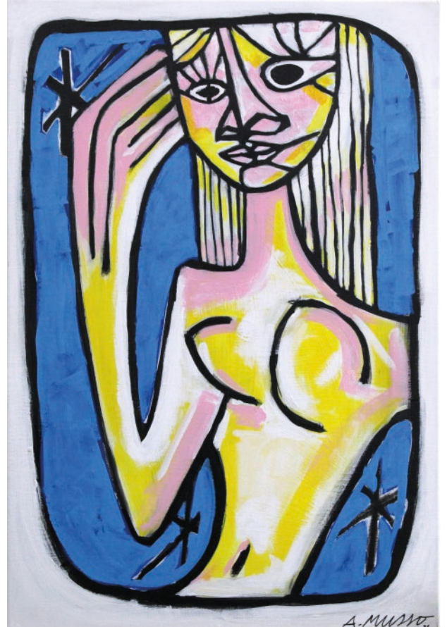
Femme avec la main dans les cheveux. Peinture sur toile format 55 x 38 cm.