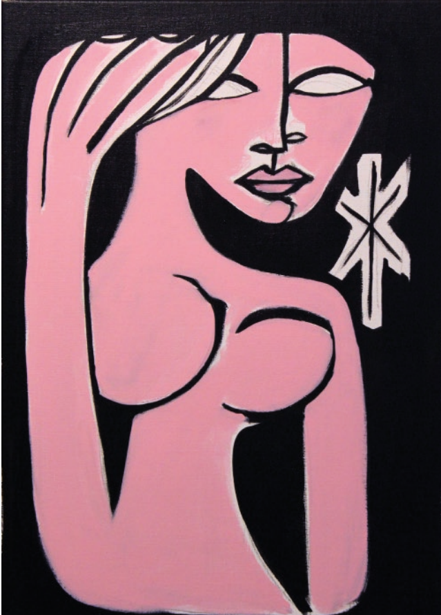
Femme avec la main dans les cheveux. Peinture sur toile format 55 x 38 cm.