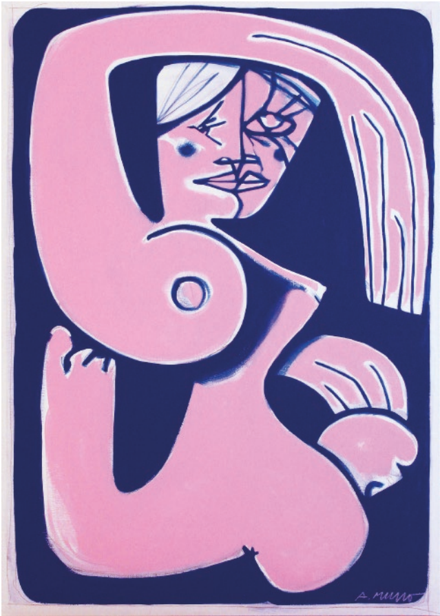
Le bain de soleil rose. Peinture sur toile format 92 x 65 cm